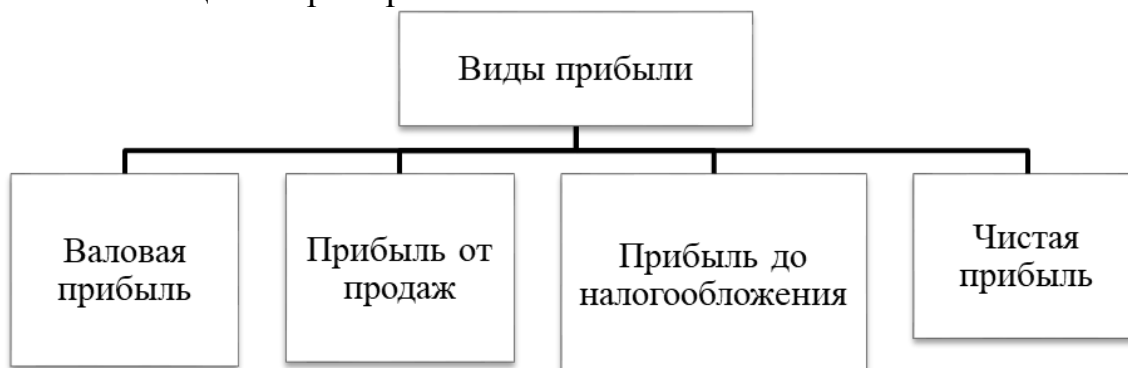
Рисунок 1 – Виды прибыли

Каждый рисунок должен сопровождаться содержательной подписью, которая размещается под рисунком в одну сторону с номером. Название рисунка всегда начинается с прописной буквы, Times New Roman 14, без точки в конце. Например: